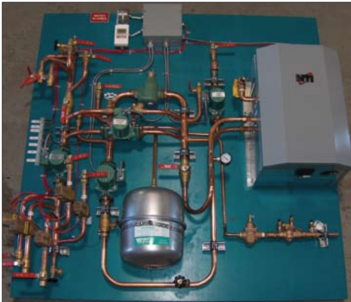
Panels are fabricated for all sizes of residential and commercial hydronic heating systems.

Fabrication d'un panneau de distribution primaire destiné à servir dans un projet de restauration d'un immeuble en copropriété.