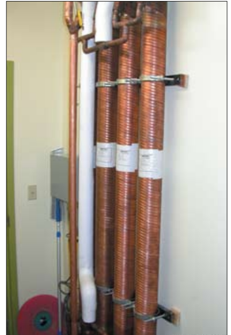
Quatre échangeurs thermiques Power-Pipemc posés à l'usine de sauce à spaghetti Unilever Ragu.