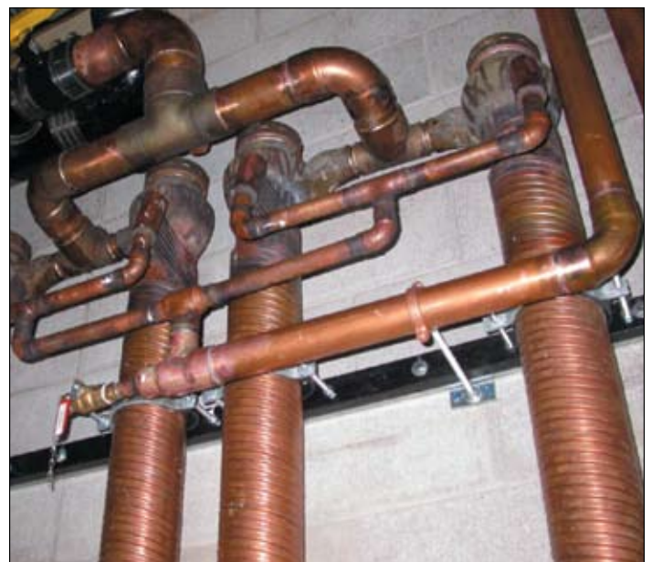
Des échangeurs thermiques Power-Pipemc posés dans un club de santé Goodlife.

Pour obtenir des détails sur ce tube, rendez-vous à www.renewability.com ou faites sans frais le 1-877-606-5559.