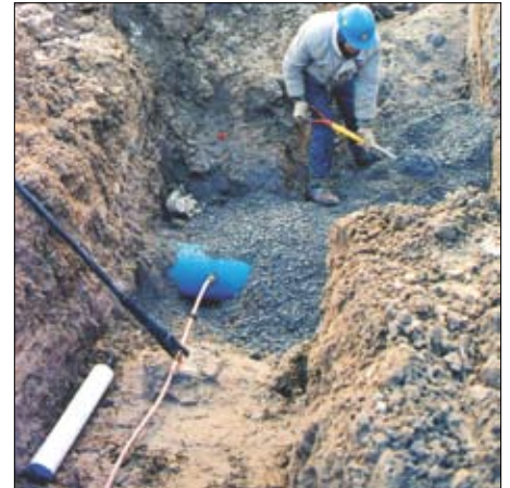
Backfilling of an underground water installation, showing the main, service, anode and curb stop.