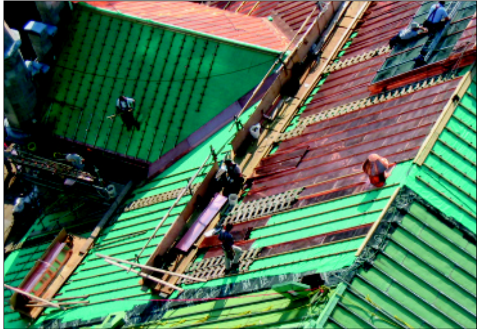
La complexité de cet immense projet est évidente de cette vue à partir du haut de la toiture principale.