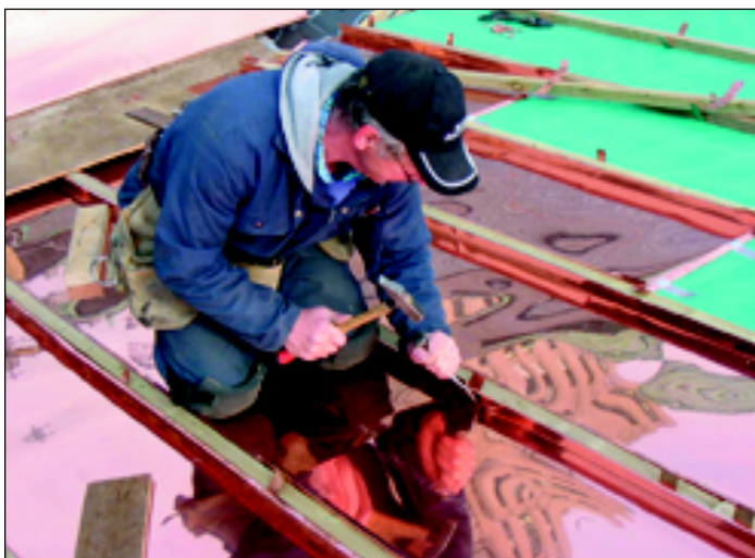
Pose des panneaux en cuivre de la toiture utilisant des outils manuels.

Installing the copper roof pans using hand tools.