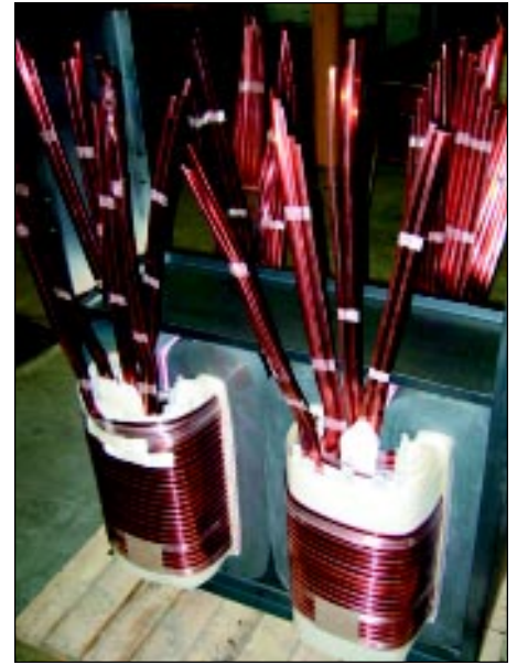
Copper magnet wire is used for the windings of transformers.