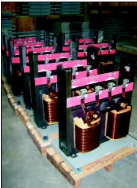
Finished transformers ready for shipment.

Marcus manufactures a variety of transformers, which is a device used to scale down the electrical power supply coming into a building or other point of use. This happens in a number of steps. Electricity first flows over high-voltage transmission lines to a series of sub stations. At this point, the voltage is stepped down by transformers to lower levels for distribution to customers, which can include everyone from a mine, to a manufacturing facility, to a homeowner, each requiring different end-voltage levels. Primary lines may carry voltages as high as 500,000 volts. Secondary lines to homes are reduced to 240 volts or 120 volts.