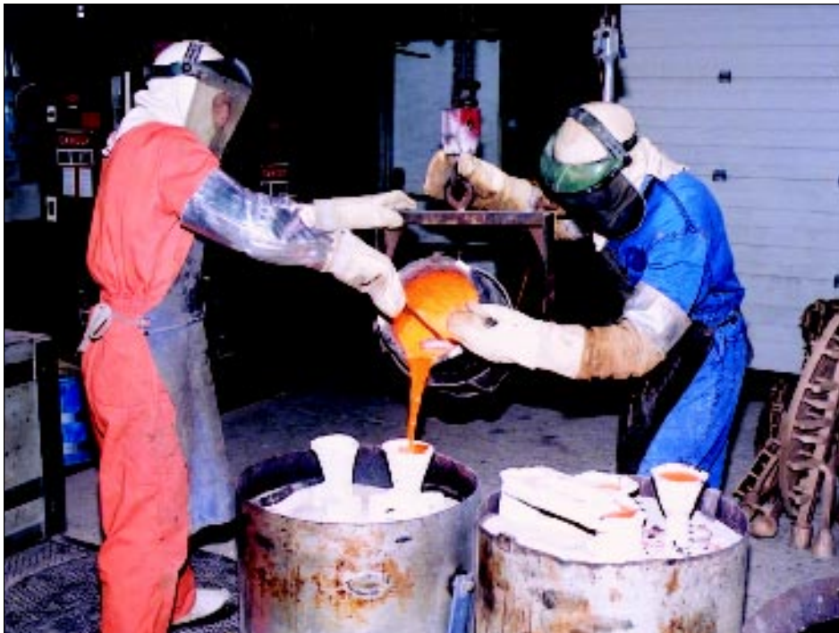
Artcast personnel pouring bronze into molds for the Waxman sculpture.