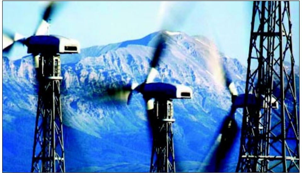
Des éoliennes dans la région de Pincher Creek en Alberta, une des régions les plus venteuses du Canada.

Le Canada dispose actuellement d'environ 137 mégawatts (MW) d'installations éoliennes produisant approximativement 302 millions de kilowatt-heures (kW) d'électricité par an. La centrale éolienne Cowley Ridge Wind Plant de la Canadian Hydro Developers, qui a été mise en service en Alberta en 1994, constitue la première centrale éolienne commerciale du Canada. Vision Quest Windelectric Inc. exploite aussi plusieurs centrales éoliennes en Alberta et entend y étendre ses opérations. La plus récente et importante centrale éolienne au pays demeure toutefois Le Nordais, qui a été achevée par AXOR en 1999 en deux sites de la région gaspésienne au Québec. Ce projet compte 133 éoliennes industrielles ayant une puissance nominale de 750