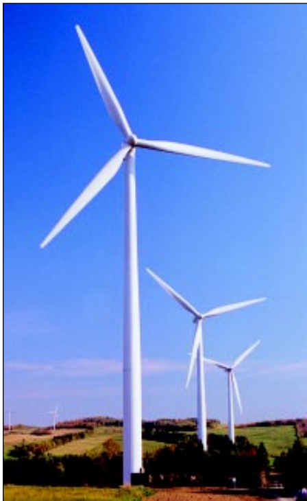
Le Nordais in Quebec's Gaspé region is presently Canada's largest wind farm with an installed capacity of 100 megawatts.

As an example the Toronto Renewable Energy Co-operative (TREC) estimates that a 660 kW wind turbine located at a waterfront setting in Toronto can eliminate 1.4 million kg per year (1500 tons) of carbon dioxide, one of the more danger-