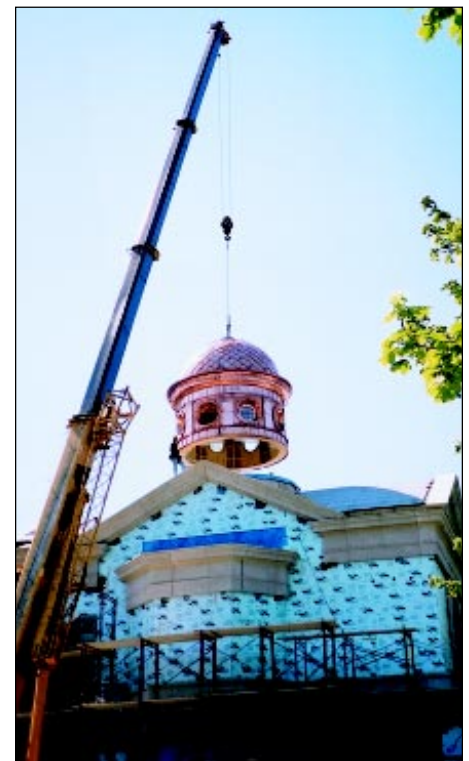
Hoisting the Holy Family Church dome.

in controlled shop conditions, particularly in regard to the elimination of scaffolding on-site and time lost due to bad weather. About 35,000 pounds (16,000 kgs) of copper and lead-coated copper sheet was supplied by Canadian Brass & Copper for the two projects. The life expectancy of these copper structures, upwards of 100 years, will pay off even more as the materials age and patinate, resulting in beautiful, natural, copper installations. ♦