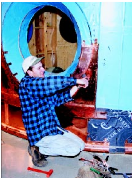
Cladding a window opening of the base of the dome.

The lead-coated copper used was 16-oz. material, and with its natural gray