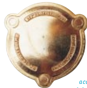
The untrimmed access cover above and the machined version below.