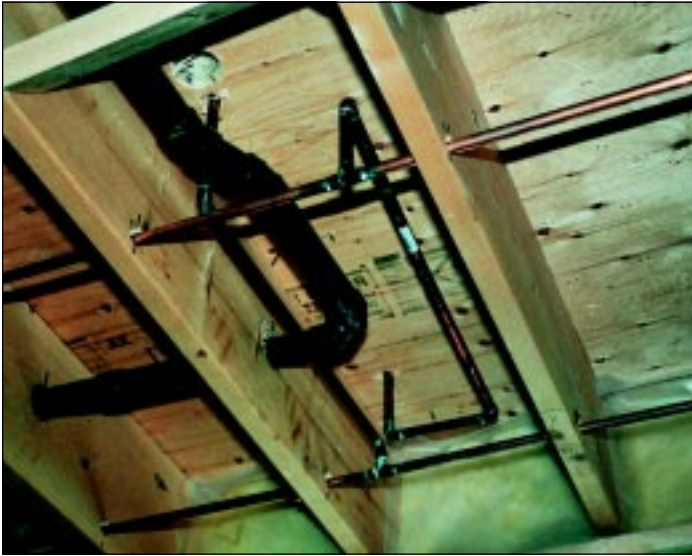
Copper tube and fittings are easily installed in joist spaces in this installation.

Les tubes et les raccords en cuivre sont facilement posés dans les solives.