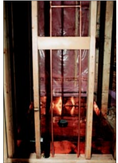
Lignes d'alimentation en cuivre pour une douche ainsi qu'un bassin de douche également en cuivre.

pouvait servir de conduite pour l'eau chaude et l'eau froide. Et cela, malgré des études ayant démontré que les tubes à paroi plus épaisse avaient été surestimés et qu'il était possible de réduire l'épaisseur de la paroi des tubes de type K et L sans diminuer l'excellent rendement du réseau cuprifère d'alimentation en eau. On savait aussi que le tube de cuivre, dont la paroi est plus mince et qui est presque identique au tube de type M, était utilisé sans problème au Royaume-Uni depuis