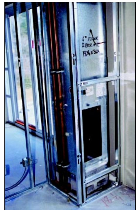
Photo de droite : Des conduites d'alimentation d'eau chaude et d'eau froide sont reliées à l'échangeur thermique de la chaudière à air forcé dans un condominium.

Right photo: Copper hot water lines connect to the heat exchanger in the forced-air furnace in a condominium.