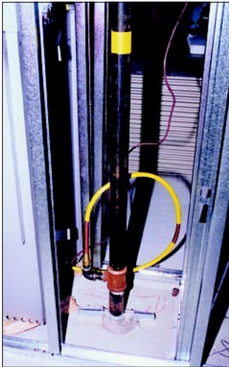
La conduite d'alimentation de gaz naturel en cuivre est reliée à la conduite principale en acier à l'aide d'un raccord en laiton évasé.