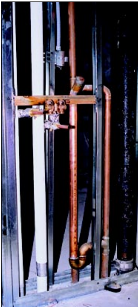
Les conduites d'évacuation DWV et d'alimentation d'eau chaude et d'eau froide de la buanderie au n° 10 Old York Mills.

of reliability make it the logical choice for potable water systems in multi-unit buildings. Copper's versatility is further demonstrated by its increasing use in natural gas distribution systems that supply the popular direct-vent gas fireplaces and compact, through-wall gas furnaces in condos. These appliances have dramatically increased the appeal to buyers of condos to the point where the vertical subdivision has definite appeal over a single-family residence.